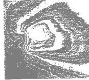
図-2. ヘレ-群星環表様ジオットによる映像(週刊読売 1986)