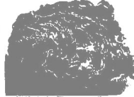
図-3. 二枚貝の貝殻の模様